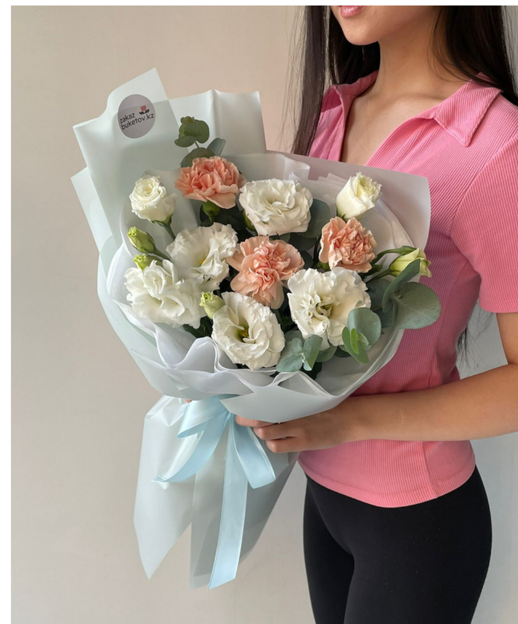
"Сэнди" 10 700 тг 9 630 тг