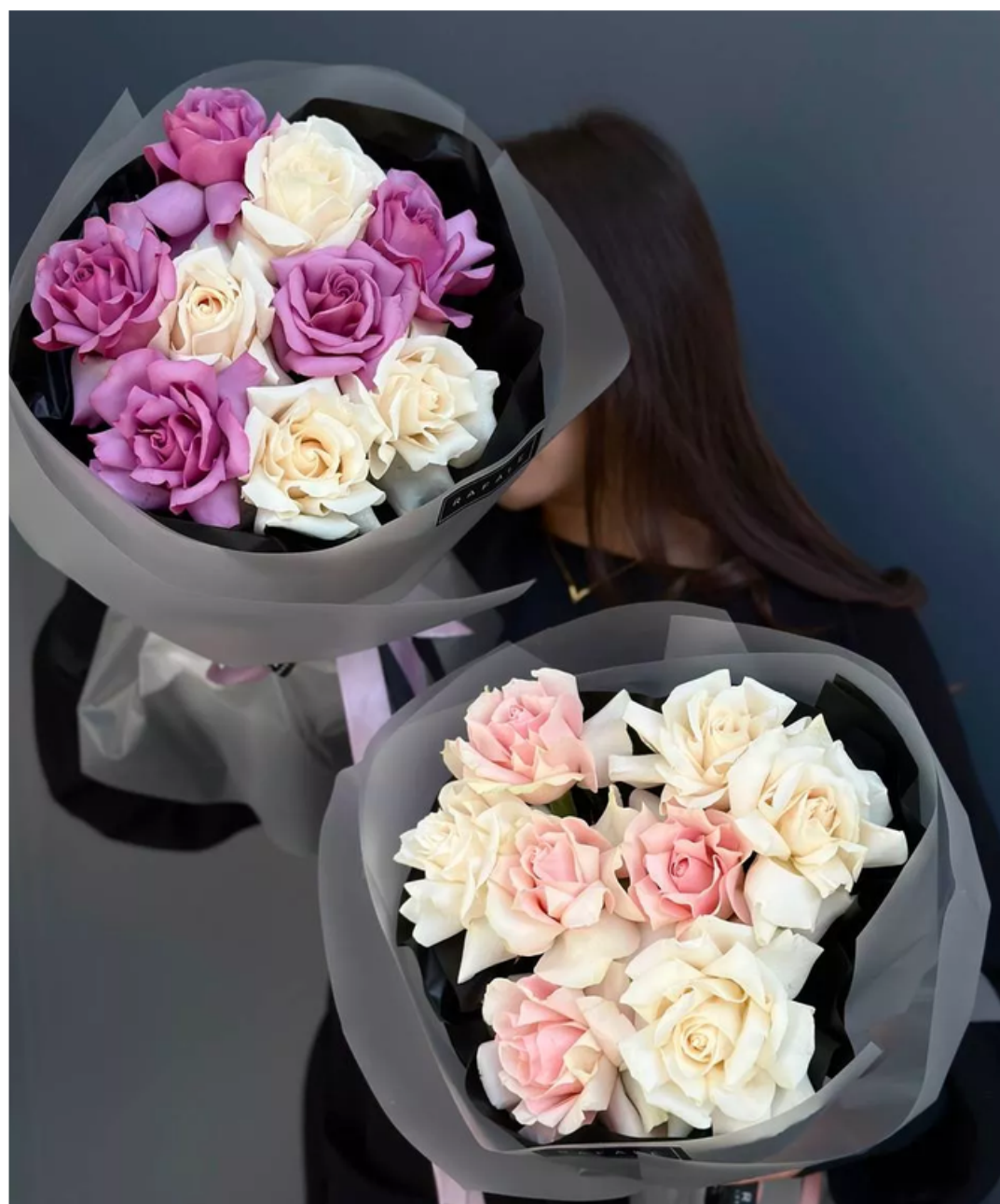
"ROSE 11.0" 11 330 тг 10 200 тг