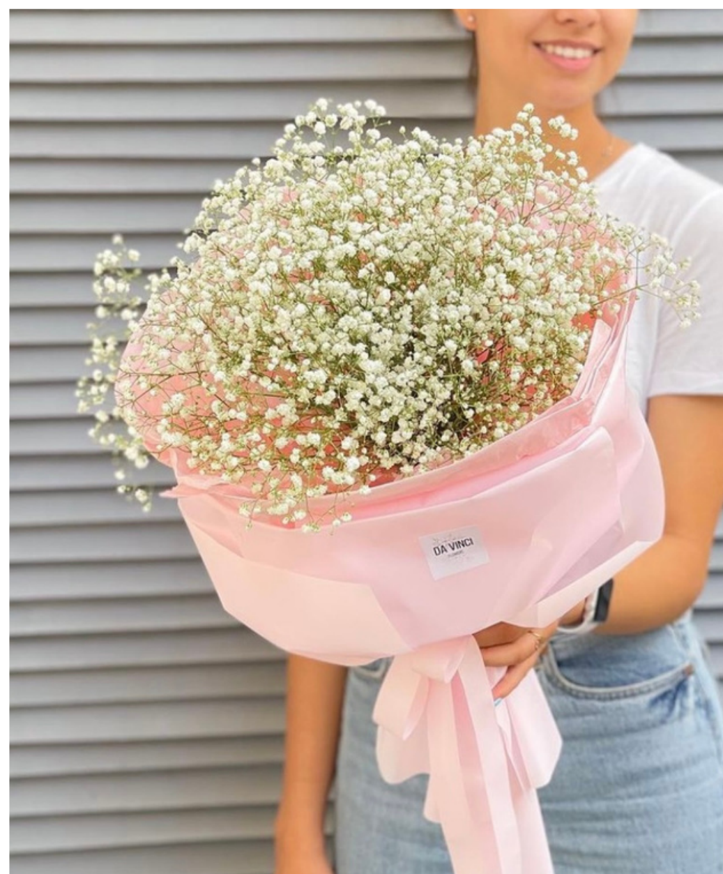
Моно букет из 5 гипсофил 11 100 тг 9 990 тг